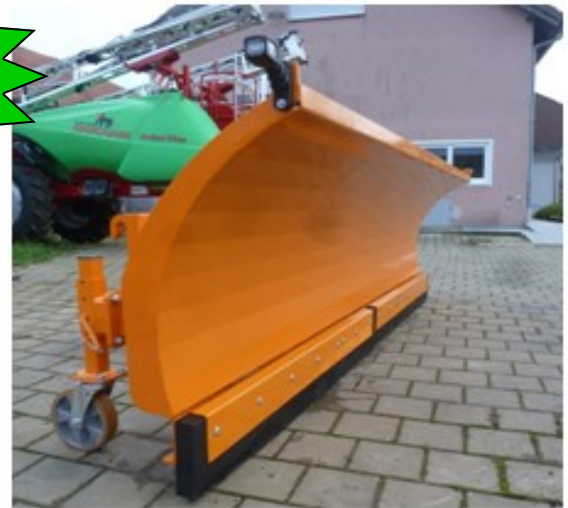
Schneeschild mit Stützäder (Option)

Schildhöhe 104 cm Stahldicke 4 mm Dreipunkt Kat. II und EURO-Aufnahme in einem Hydraulische Seitenverstellung bis 30 Grad Massive Gummi-Schürfleiste 200x50mm Federklappen mit vier massiven Federn Pendelaufhängung – seitliche Boden Anpassung LED-Grenzbeleuchtung Halterung für zusätzliche Montage von Stützräder